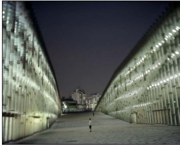
Foto exposição AJAP: Université d'Ewha – (c) Dominique Perrault - Seoul, Corée

Para visitar a exposição acesse: https://www.expoajap.com.br/